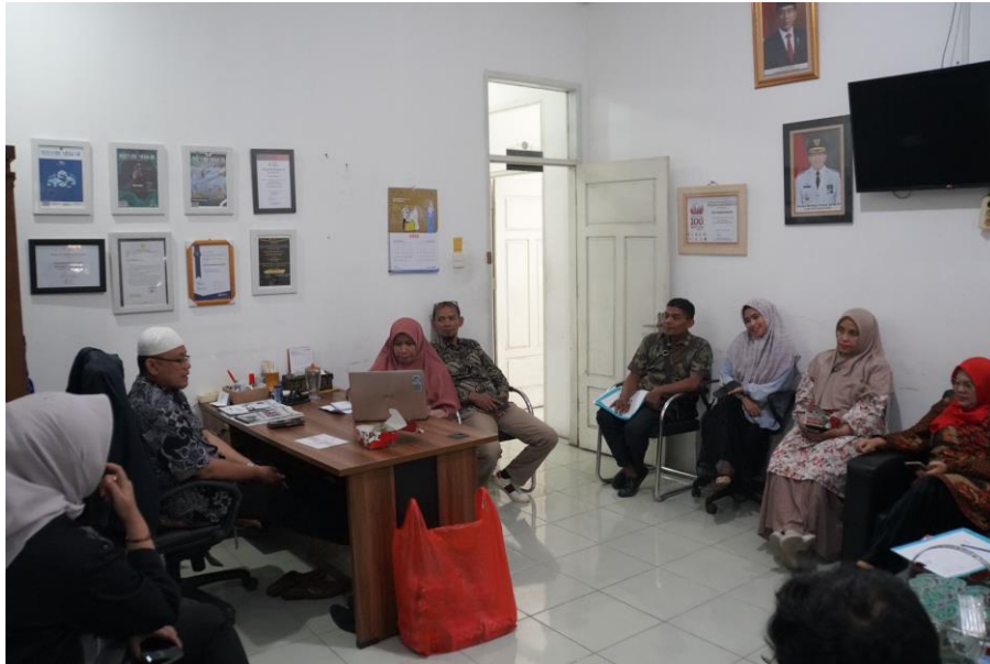
FOTO PELAKSANAAN RAPAT EVALUASI KINERJA TW IV